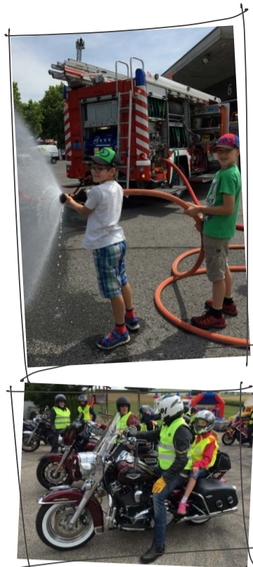
Die obenstehenden Bilder wie auch alle anderen im Jahresbericht 2018 sind an unseren Anlässen 2018 entstanden und dürfen ausschliesslich von der Kinderkrebshilfe Zentralschweiz verwendet werden.

für weitere Informationen: kinderkrebshilfe-zentralschweiz.ch