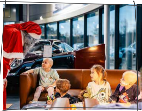
Bildlegende: Die Bilder im Jahresbericht 2024 wurden unter Einverständnis der Betroffenen gegenüber der Kinderkrebshilfe Zentralschweiz veröffentlicht und dürfen ohne ausdrückliche Erlaubnis nicht von Dritten verwendet werden.

Take a wish - make someone happy. In diesem Sinn wurden vom Porschezentrum Zug und ihren Kunden erste Weihnachtswünsche von betroffenen Kindern und ihren Geschwistern erfüllt. Eine feierliche Übergabe der Geschenke fand am 18. Dezember in Zug statt. Die Stimmung sowie die Freude der Kinder waren herzerwärmend und berührten.