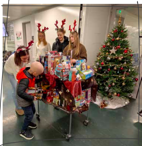
Bildlegende: Die Bilder im Jahresbericht 2025 wurden unter Einverständnis der Betroffenen gegenüber der Kinderkrebshilfe Zentralschweiz veröffentlicht und dürfen ohne ausdrückliche Erlaubnis nicht von Dritten verwendet werden.

Zum Abschluss des Jubiläumsjahres eine kleine Weihnachtsgeschichte : Vier Mädchen backten Kuchen für ein Schulprojekt und organisierten mit dem Erlös gleich selbst Geschenke für Kinder, die Weihnachten im Spital verbringen mussten – ein berührender Lichtblick am 24. Dezember .